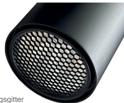
Variante mit Entblendungsgitter

Sie haben weitere Fragen zu diesem Produkt? Wir helfen Ihnen gerne!