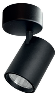
Variante mit Blendschutzgitter