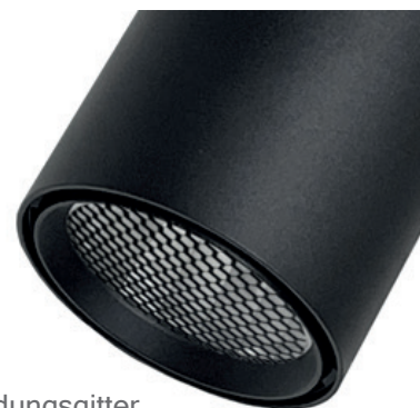
Variante mit Entblendungsgitter

Sie haben weitere Fragen zu diesem Produkt? Wir helfen Ihnen gerne!